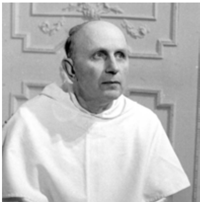
Il teologo domenicano Yves Congar